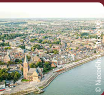
© Niederrhein - 1910 bis 1910