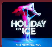
NEUE SHOW 2024/2025